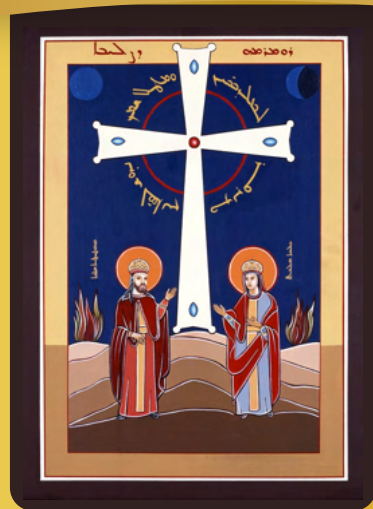
Second Sunday after the Glorious Cross Mt 24: 1-14 | 1Cor 15: 19-34

This is a critical lesson for us to learn from this Gospel: should we become despondent when we experience hardships, difficulties,