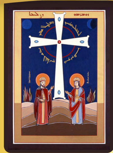
First Sunday after the Glorious Cross Mk 10: 35-45 | 2Tim 2: 1-10

The fact that James and John left the group to make their request, to distinguish themselves, angers the other 10 disciples. Jesus then addresses all His disciples and His words resound through history to His Church and to every believer: "Whoever wishes to become great among you must be your servant, and whoever wishes to be first among you must be slave of all. For the Son of Man came not to be served but to serve, and to give his life a ransom for many." (Mk 10: 43-45)