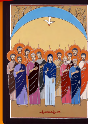
Twelfth Sunday of Pentecost Mt 15: 21-28 | Eph 3: 1-13

Today, Lebanon, the home of this Canaanite woman and of her daughter, and the homeland to most of the Maronites all around the world, is suffering, in a way which we have never seen since the days of the civil war, and which we had thought and prayed were gone forever. Perhaps we can see a parallel in the daughter of the Canaanite woman: she is being tormented by demons and