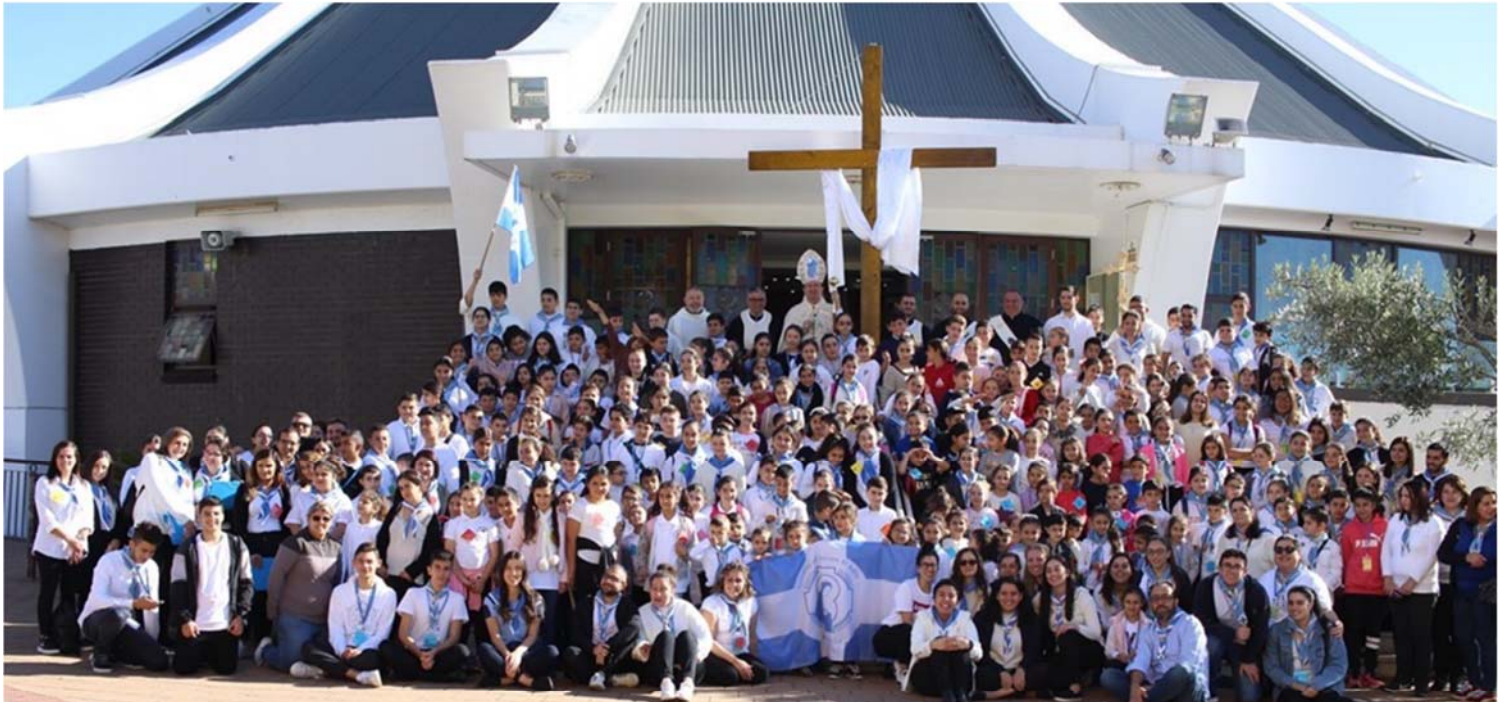
Fersen Day 2019