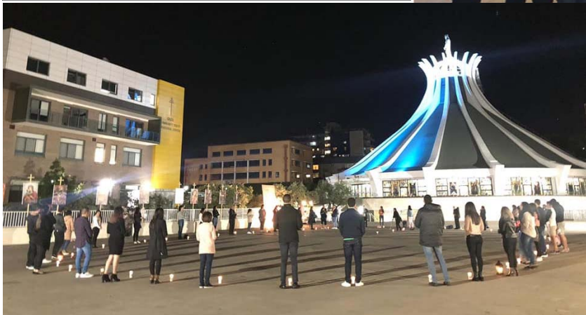
MYO - The Human Rosary