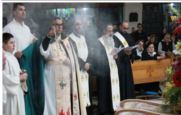
St Mary of the Cross Mackillop Feast Mass