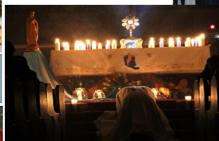
Eucharistic Adoration & Procession