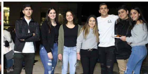
OLOL Youth BBQ Night