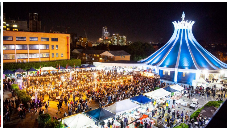
FW 18 Opening Mass and Souk Night