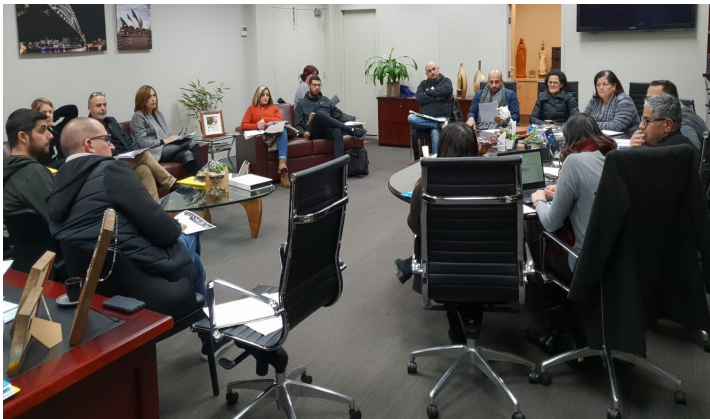
Pastoral Council Monthly Meeting