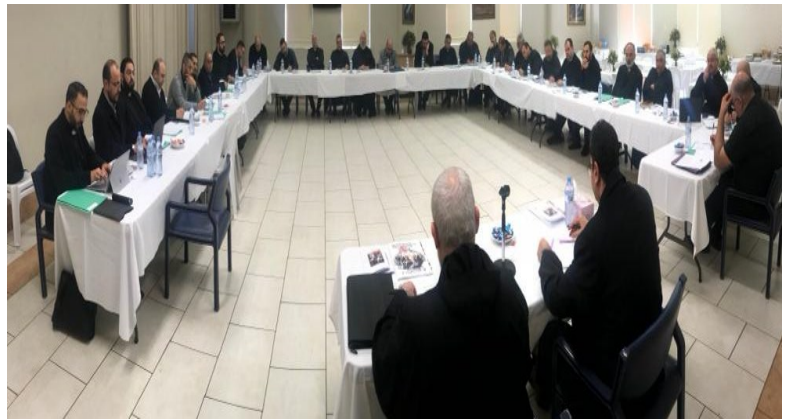
Diocesan Clergy Meeting - July 2018