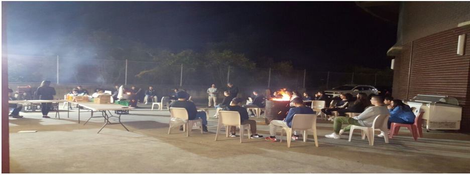
Come Alive Bonfire