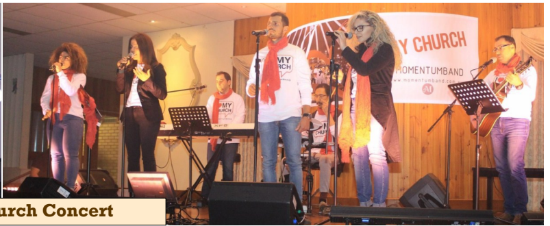
My Church Concert