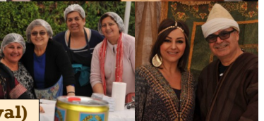
OLOL Souk (Market Festival)