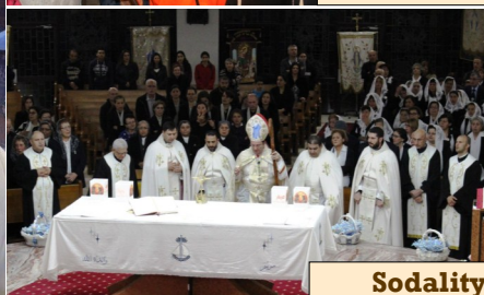
Sodality 40th Anniversary