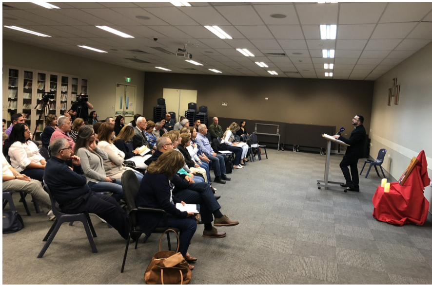
Family of The Divine Word - Weekly Talk