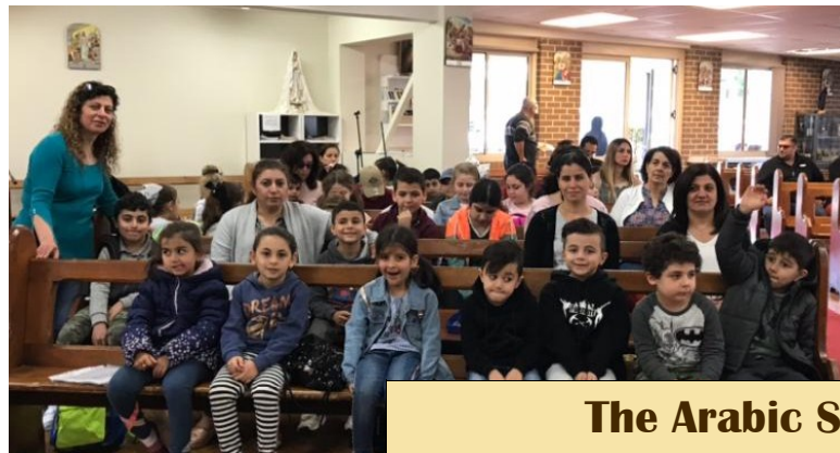
The Arabic School Activities