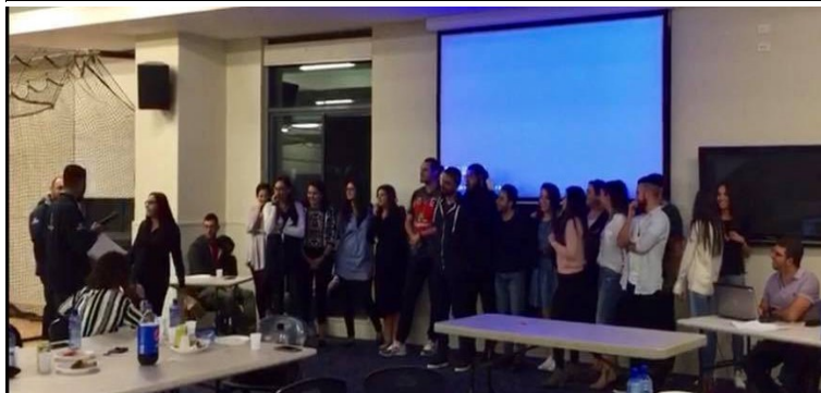
OLOL Youth - Trivia Night