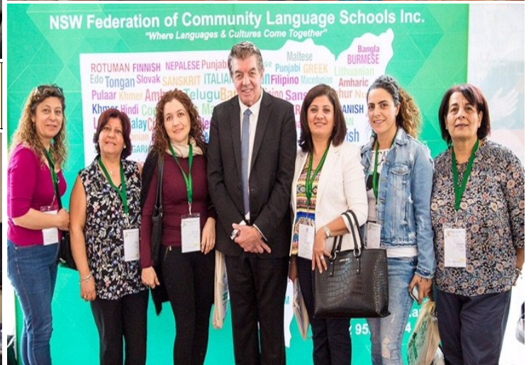
OLOL Arabic School Teachers at the 2018 NSW Federation of Community Language Schools Annual Conference