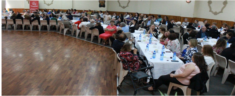
Mother's Day Mass & Function