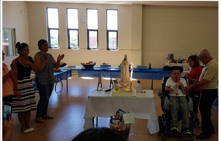
Faith and Light Committee Birthday Brunch