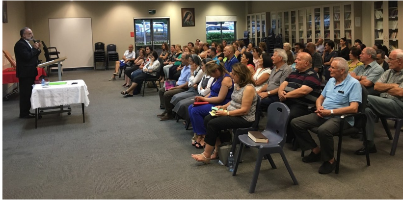
Family of The Divine Word Weekly Talk