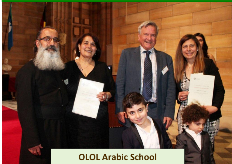
OLOL Arabic School