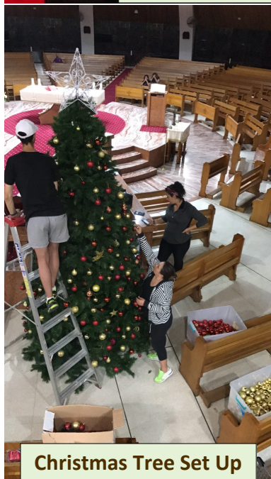
Christmas Tree Set Up