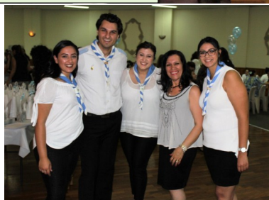
Fersen Al Adra Consecration