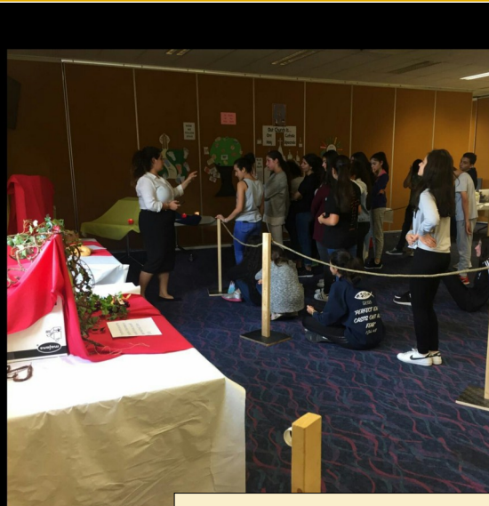
Year 8 Teen's Lesson/Museum Last Week "Who is Jesus?"