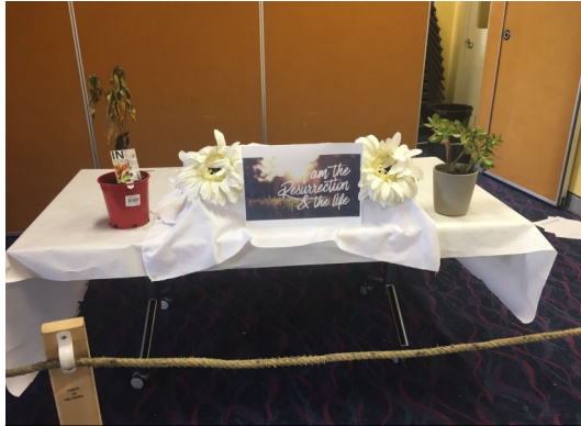
Year 8 Teen's Lesson/Museum Last Week "Who is Jesus?"