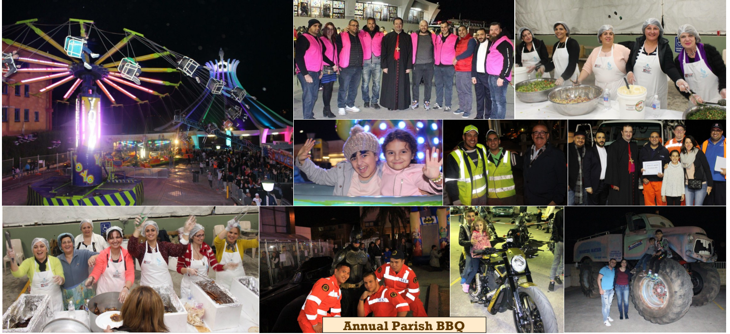
Annual Parish BBQ