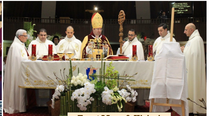
Feast Mass & H'rissi