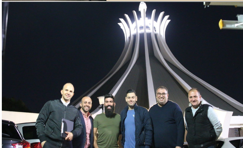
Knafeh Boys & management prepare for feast week