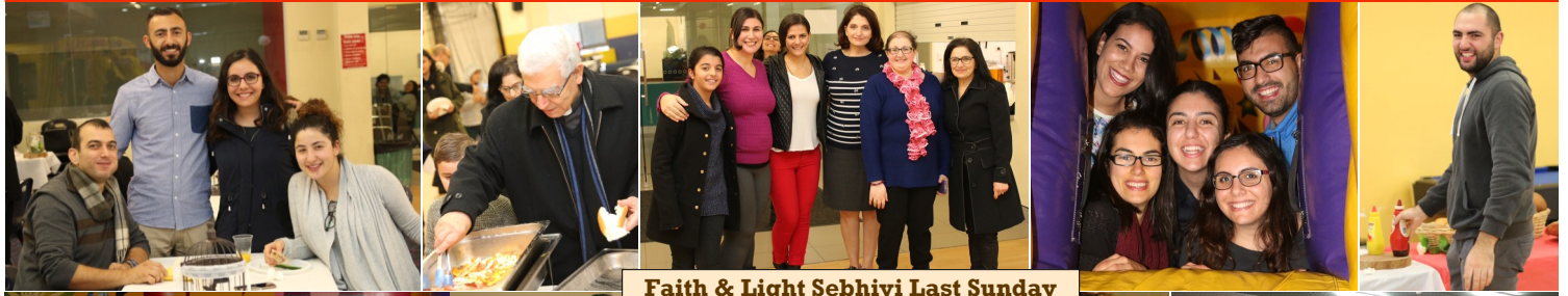
Faith & Light Sebhiyi Last Sunday