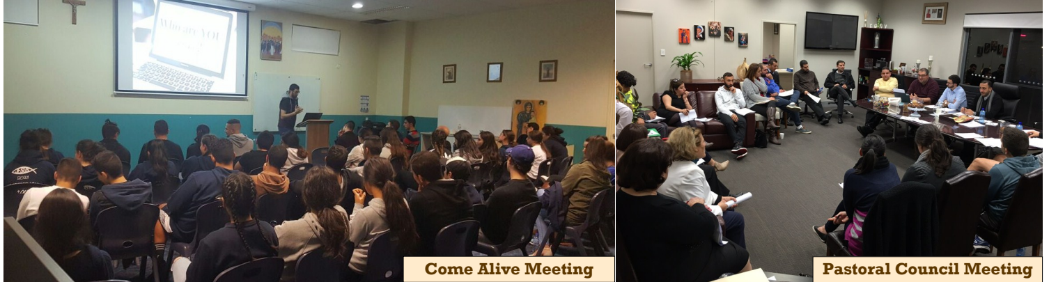
Come Alive Meeting