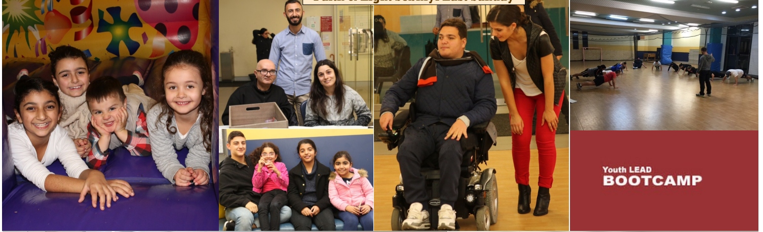
Youth LEAD BOOTCAMP