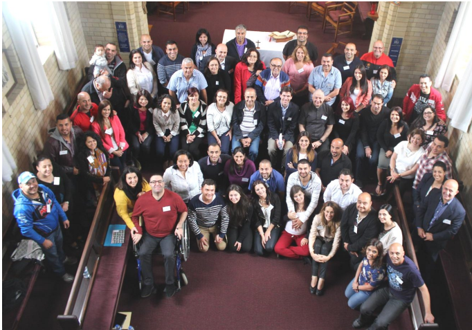
Family choir happy and growing. Practice for 9:30am Mass & Carols Wednesdays 6pm all welcome